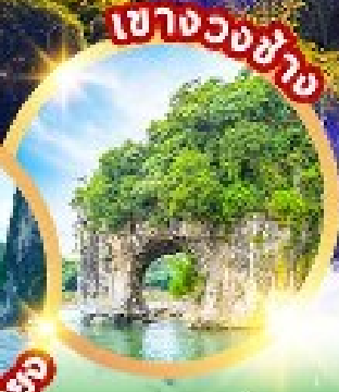
เขาวงช้าง