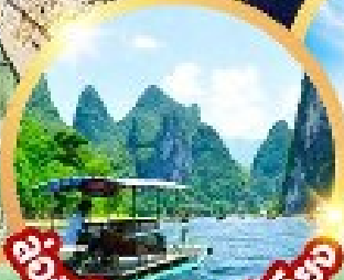
ล่องเรือแม่น้ำหลี่เจียง