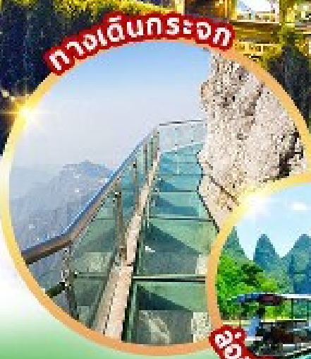
ทางเดินกระจก