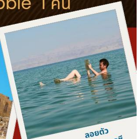
ลอยตัว ทะเลสาบ เดดซี