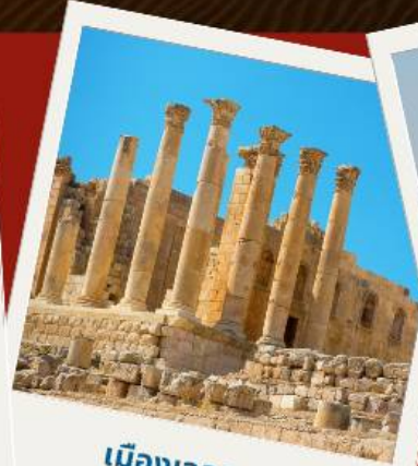
เมืองเจอราซ