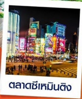
ตลาดซีเหมินติง