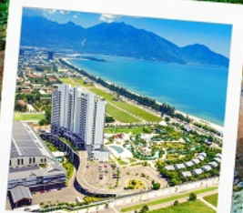
Mikazuki Japanese Resorts & Spa