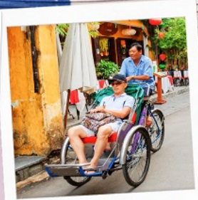
รถสามล้อ Cyclo