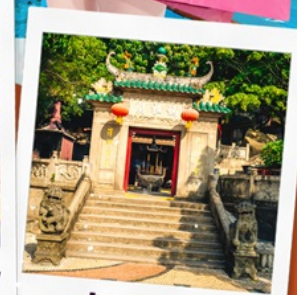
วัตอาม่า