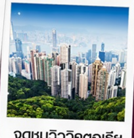
จุดชมวิวิวิคตอเรีย