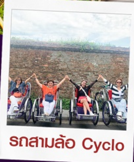
รถสามล้อ Cyclo