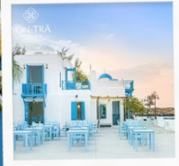
ซานตารีนาคาเฟ่