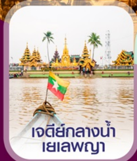
เจดีย์กลางน้ำ เยเลพญา