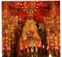
เจ้าแม่กวนอิมวัดสองฮา