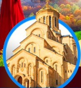
โบสถ์กรินดี เมืองทบิลีซี