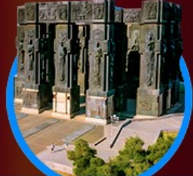
อนุสาวรีย์ประวัติศาสตร์