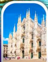
DUOMO MILAN ITALY