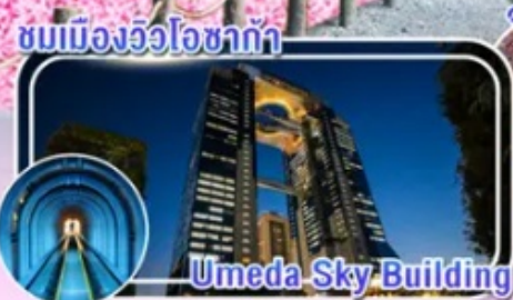
Umeda Sky Building