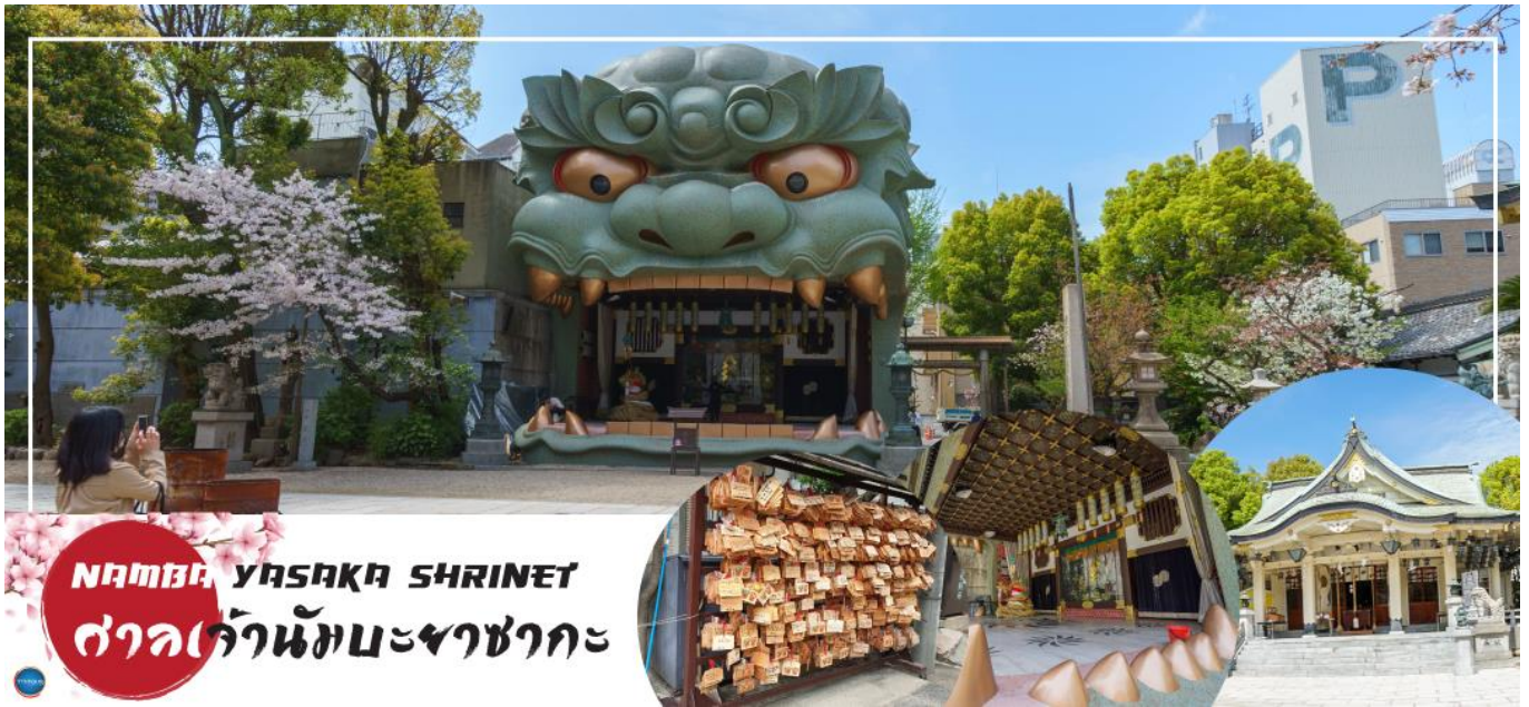
NAMBA YASAKA SHRINE ศาลเจ้านัมมะยาซากะ

วันที่สี่ เมืองโอซาก้า – ศาลเจ้านัมมะยาซากะ – ตลาดคุโรมง – Mitsui Shopping Park LaLaport Sakai – ห้างอ็อน มอลล์ ริงกุเซ็นัน – ท่าอากาศยานนานาชาติคันไซ – ท่าอากาศยานนานาชาติดอนเมือง