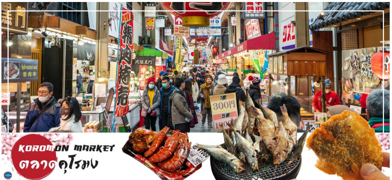
KUROMON MARKET ตลาดคุโรมง

จากนั้นนำท่านเดินทางสู่ ตลาดคุโรมง โอซาก้า (Kuromon Ichiba Market) เป็นตลาดที่มีชื่อเสียงและเก่าแก่ที่สุดแห่งหนึ่งของเมืองโอซาก้า บรรยากาศภายในเป็นทางเดิน Arcade เล็กๆ ทอดยาวประมาณ 600 เมตร 2 ข้างทางจะเต็มไปด้วยร้านค้าต่างๆกว่า 160 ร้านค้าขายทั้งของสด และแบบพร้อมทาน มีของกินเล่นและอาหารพื้นเมืองมากมายหลายชนิดให้ได้ชิมกัน