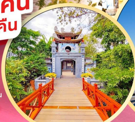
วัดห่งอกเซิน