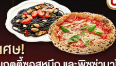
พิเศษ! สปาเกตตี้ซอสหมัก และพิซซ่านาโปลี