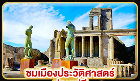
ชมเมืองประวัติศาสตร์ ปอมเปอี