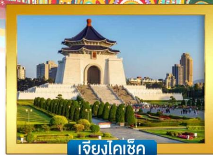
เจียงไคเช็ค