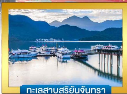
ทะเลสาบสุริยันจันทรา