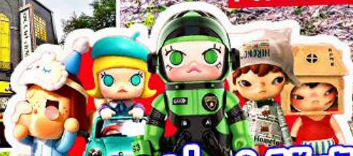
เริ่มต้น