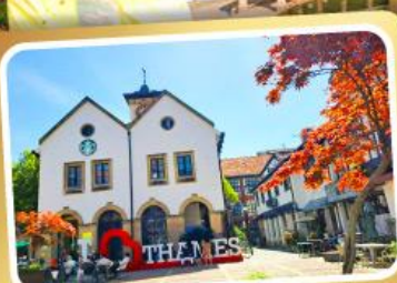
เกมส์ทาวน์