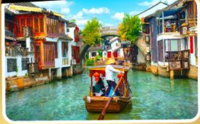
เมืองโบราณจูเจียเจียว