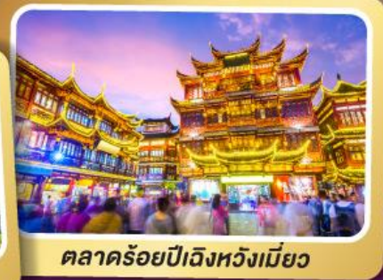
ตลาดร้อยปีเจิ้งหวังเมี่ยว

สนุกสุดมันส์ไปกับเครื่องเล่น Shanghai Disneyland เต็มวัน