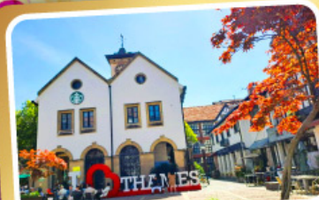
เทมส์ทาวน์