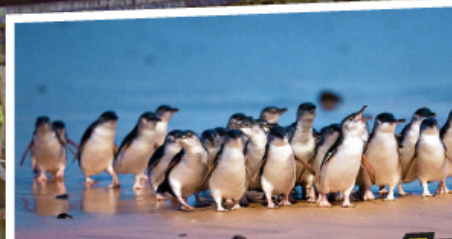
ชมความน่ารักตามธรรมชาติของ พวงเพนกวินพาเหรด ณ เกาะฟิลลิป