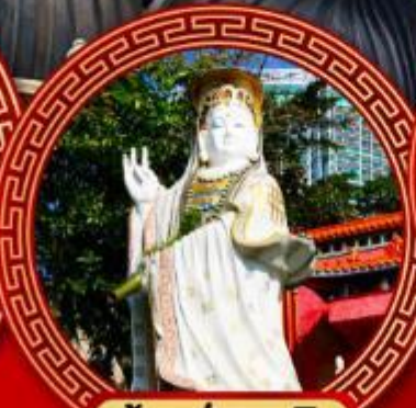
เจ้าแม่กวนอิม รพีลส์เบย์