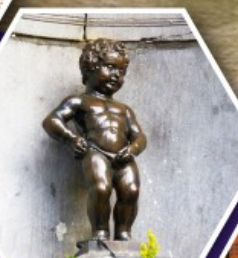
แมนเกินฟิส