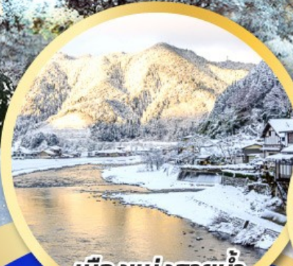
เมืองแห่งสายน้ำ กุโจะจิมัง