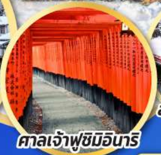
ศาลเจ้าฟูชิมิอินาริ