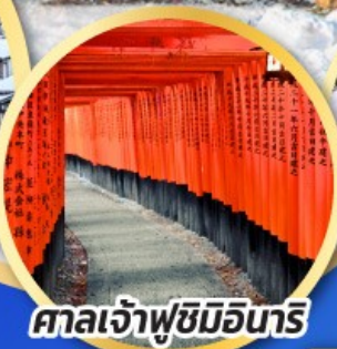
ศาลเจ้าฟุชิมิอินาริ