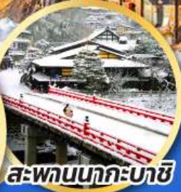
สะพานนากะบาชิ

ชมเมืองแห่งสายน้ำ บรรยากาศย้อนยุค "กุโจะจิมัง"