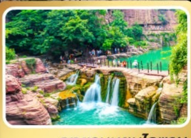
อุทยานหยุ่นโกซ่าน