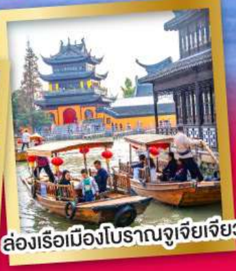
ล่องเรือเมืองโบราณจูเจียเจียว