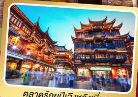
ตลาดร้อยปีอิงหวังเมี่ยว