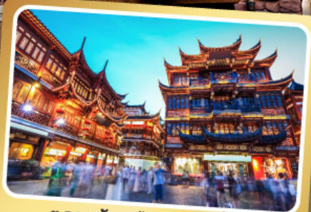
ตลาดร้อยปีเฉิงหวังเหมียว