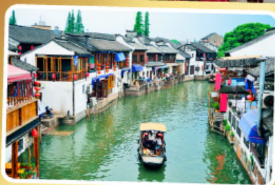
เมืองโบราณจู่เจียเจี้ยว