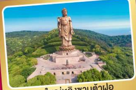
พระใหญ่หลิงซานต้าฝอ