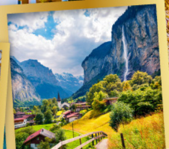
เลาเทอร์บรุนเนิน