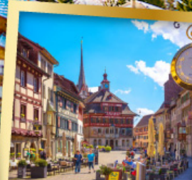
ชไตน์ อัม โรน์