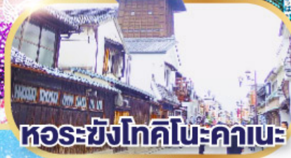
หอรังโทคิโนะคานะ