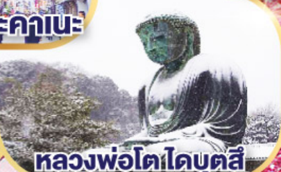
หลวงพ่อโตโตบุตสึ