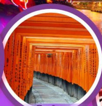
ศาลเจ้าฟุชิมิอินาริ