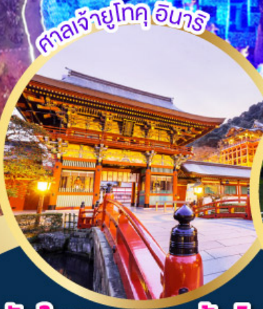
ศาลเจ้ายูโทคุ อินาริ