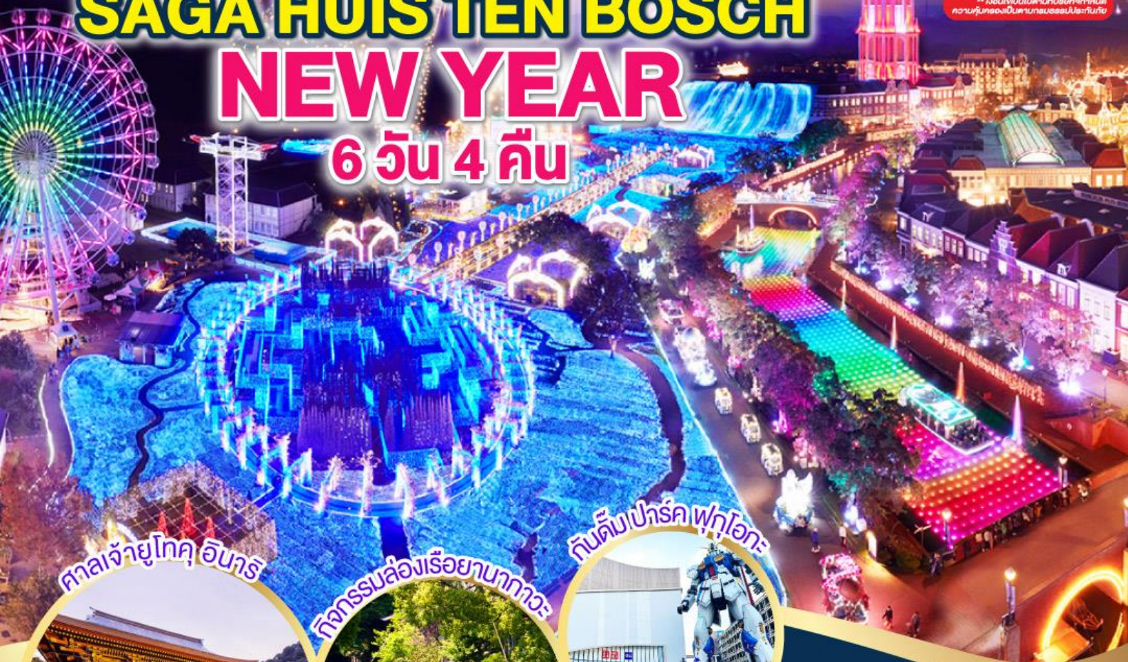
ศาลเจ้ายูโทคุ อินาริ