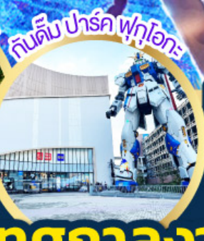
กันดั้ม ปาร์ค ฟุคุโอกะ