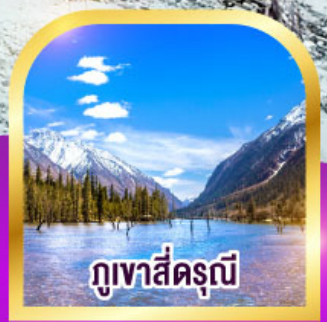
ภูเขาสี่ฤดู