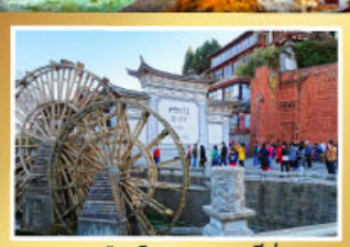
เมืองโบราณแชงกรี่ล่า