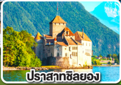
ปราสาทชิลยอง