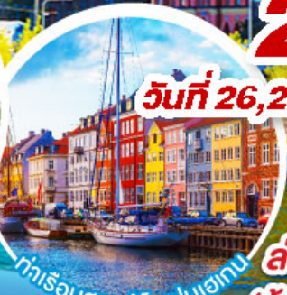
ท่าเรือฮาวน์.โตปเปอร์เกน