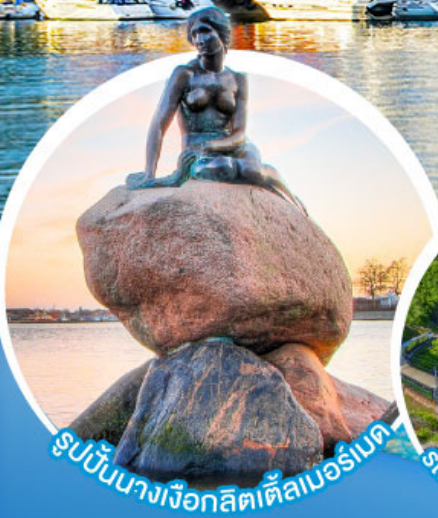
รูปปั้นนางเงือกสีดัลไมเบอร์ก