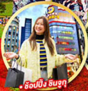
• ช้อปปิ้ง ชินจูกุ

กิจกรรมใส่ชุดกิโมโน พร้อมชมโชว์การแสดงต่างๆ