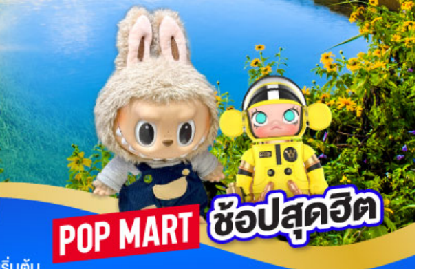
POP MART ซ้อปสุดฮิต