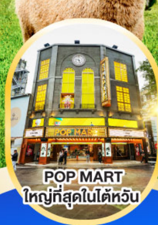
POP MART ใหญ่ที่สุดในไต้หวัน

ฟรี ประกันสุขภาพ และอุบัติเหตุ Include ไทยวิวัฒน์ GTIP Plus (Gold Plan) 3 ล้านบาท *คุ้มครองสูงสุด ** เงื่อนไขเป็นไปตามที่บริษัทกำหนด ความคุ้มครองเป็นไปตามกรมธรรม์ประกันภัย 5วัน3คืน