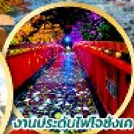
งานประดับไฟโจซังเค