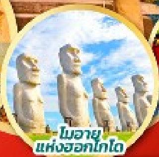
โมอาย แห่งออกโทโต