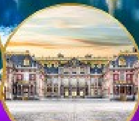
พระราชวังแวร์ซายส์