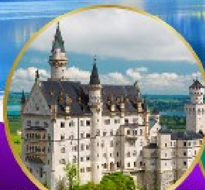
ปราสาทนอยชวานสไตน์