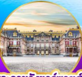
พระราชวังแวร์ซายส์