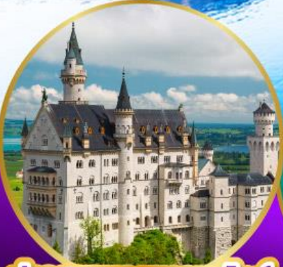
ปราสาทนอยชวานสไตน์