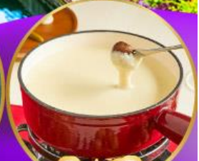
ฟองดูซีส