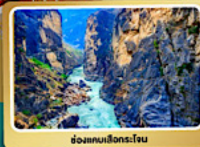
ช่องแคบเลียงระโงน