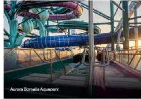
Aurora Borealis Aquapark