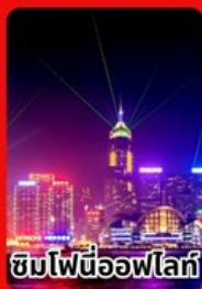
ชิมไฟนีออฟโล่กั้