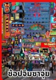
ช้อปจิมซาจุ้ย