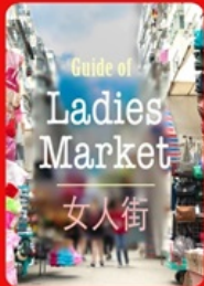
Guide of Ladies Market 女人街