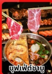
บุฟเฟต์ซาบู