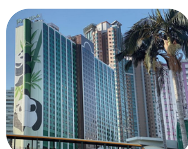
Panda Hotel (ซุนหวาน)