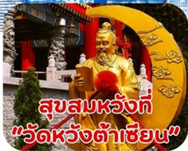
สุขสมหวังที่ "วัดหวังต้าเซียน"

แพ็คเกจทัวร์ฮ่องกง 3 วัน 2 คืน ที่คุ้มค่าที่สุดสุดในสามโลก