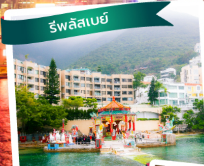
วัดหลิวเบย์