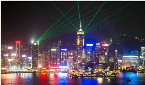
Symphony of Lights