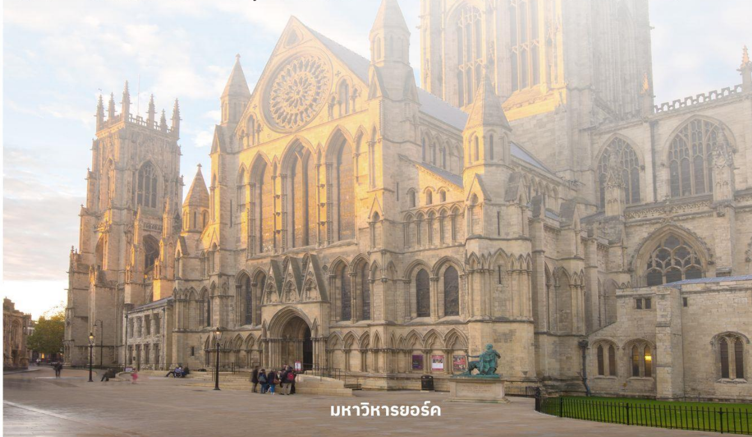
มหาวิหารยอร์ก

จากนั้นนำท่านเดินทางต่อไปที่ The Shambles (เดอะแซมเบิล) เป็นสถานที่ที่มีความคล้ายกับตรอกไดอากอนในภาพยนตร์ชื่อดังอย่าง Harry Potter อีสาระให้ท่านเดินเลือกซื้อของที่ระลึกตามอัธยาศัย