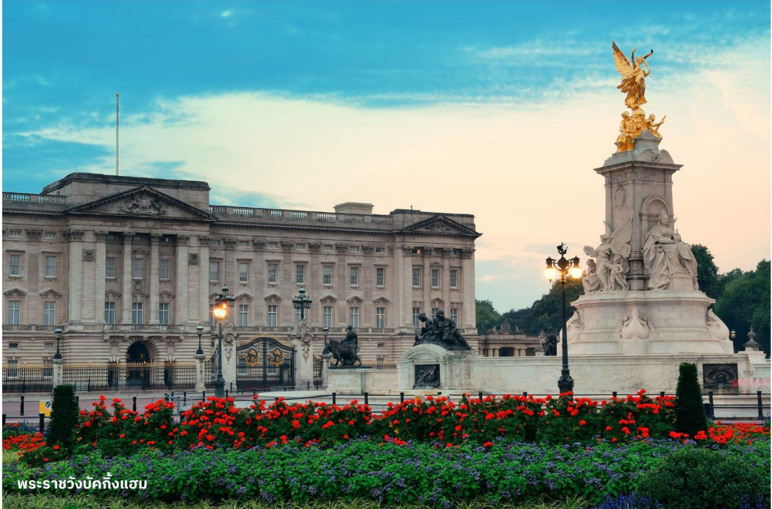
พระราชวังบักกิงแฮม

ได้เวลาอันสมควรนำท่านสู่สนามบิน เพื่อเตรียมตัวเดินทางกลับประเทศไทย