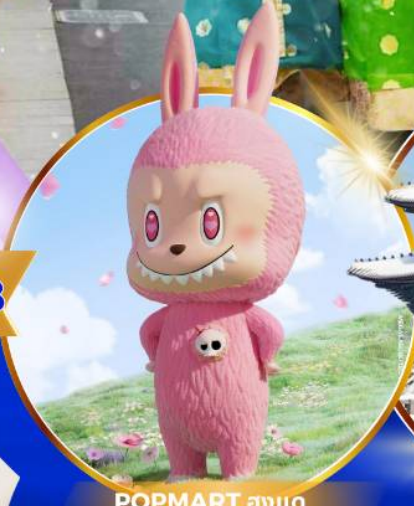
POP MART ฮงแด