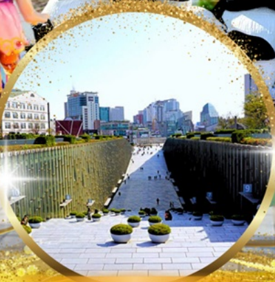
มหาลัยหญิงอีวา