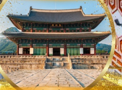
พระราชวังเคียงบกกรุง

EASTAR JET เดินทาง 이스타항공 พฤศจิกายน 2567 น้ำหนัก 20 Kg. Carry on 10 Kg.