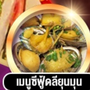
เมนูซีฟู้ดลิ้นจี่