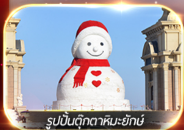
รูปปั้นตุ๊กตาหิมะยักษ์