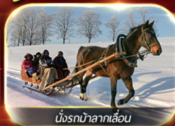
นั่งรถม้าลากเลื่อน

ฟรีนั่งรถม้าลากเลื่อน ชมโชว์ว่ายน้ำน้ำแข็ง แม่น้ำชองหวาเจียง