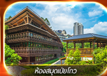
ห้องสมุดเป่ย์โกว

อาลีซาน นั่งรถไฟสายโรแมนติก ช้อปปิ้งจู่โจว ตลาดซีเหมินติง , กลอเลีย เอ๋ากั๋วเสีต ล่องเรือชมทะเลสาบสุริยันจันทรา สะพานคู่รัก ห้องสมุดเป่ย์โกว ถนนโบราณต๋ั้นฮุย