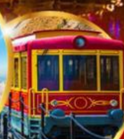
รถรางซาปา