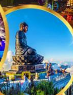
ฟานซีปัน