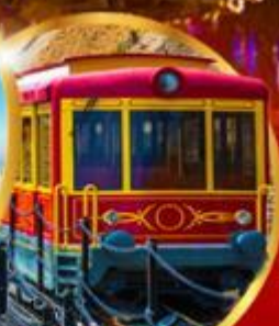
รถรางซาปา