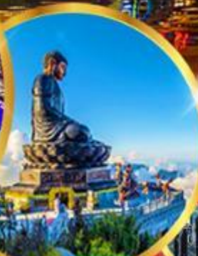
ฟานซีปัน