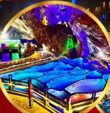
ด่านกนงาแอง