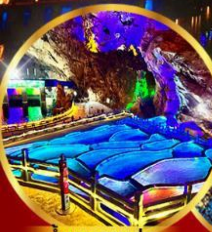
ถ้ำกนางแอน